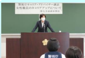
【第七方面副本部長】