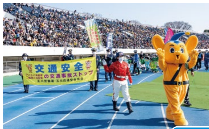
交通安全キャンペーン