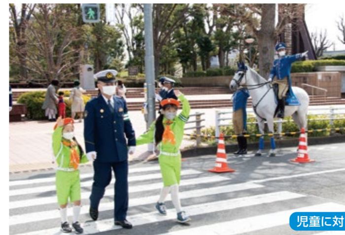
児童に対する横断訓練