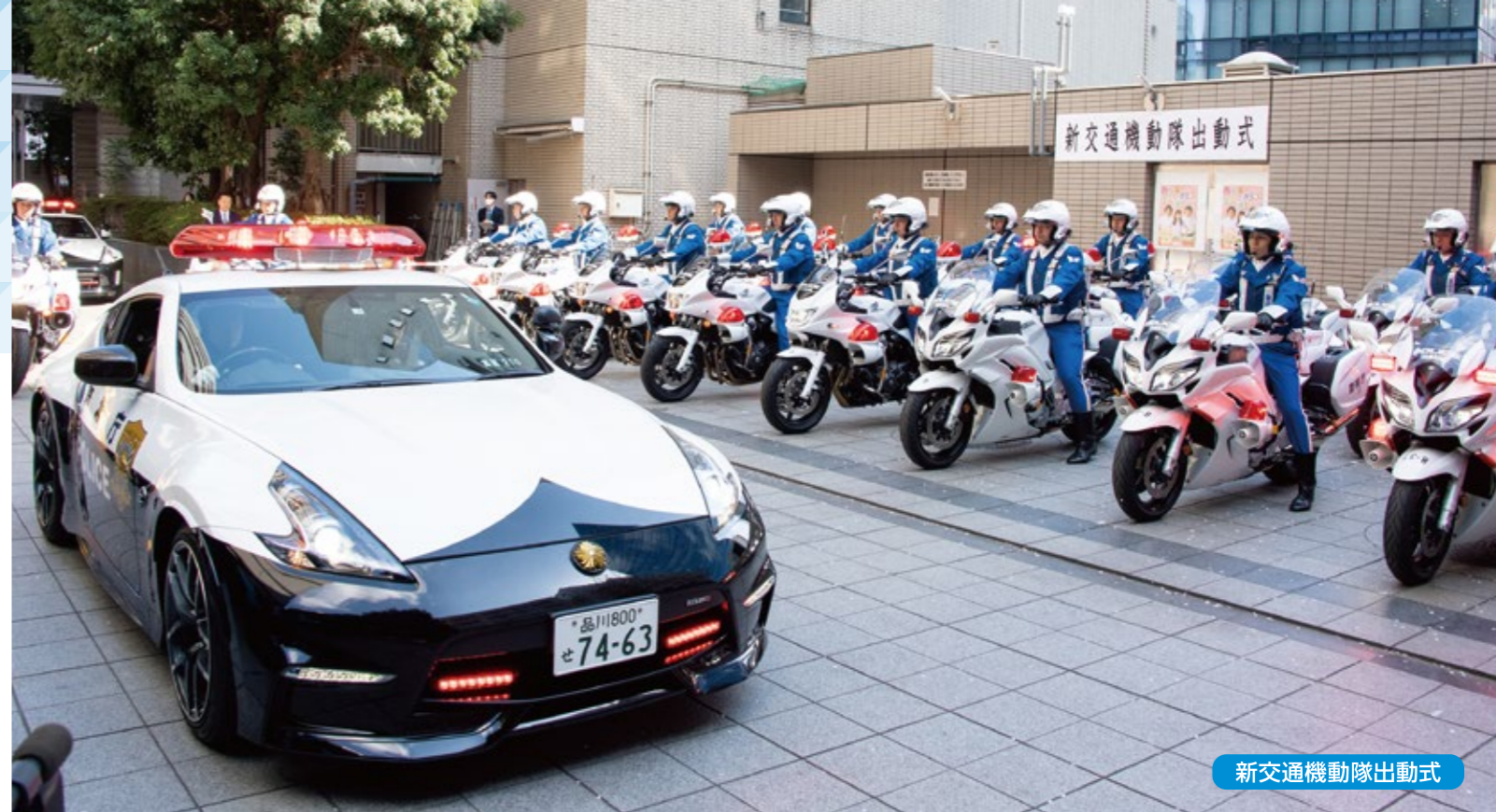
新交通機動隊出動式

交通安全教育においては、子供からお年寄りまで、幅広い対象の方々に参加・体験・実践型の交通安全教室などを開催し、交通安全意識の高揚を目指しています。