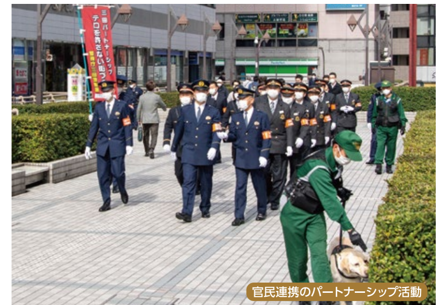
官民連携のパートナーシップ活動

また、各警察署と民間事業者、地域住民等で構成される地域版パートナーシップにおいても「テロを許さない街づくり」を合言葉に、テロ対処合同訓練、研修会、合同パトロールなど地域の特性に応じたテロ対策を推進しています。