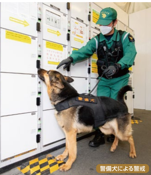
警備犬による警戒