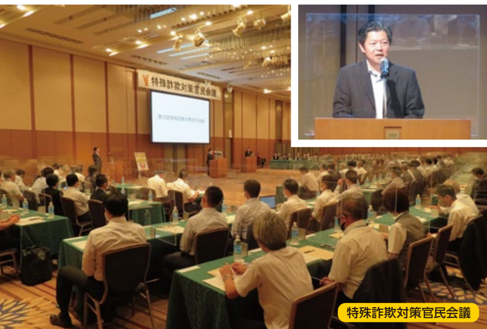
特殊詐欺対策官民会議