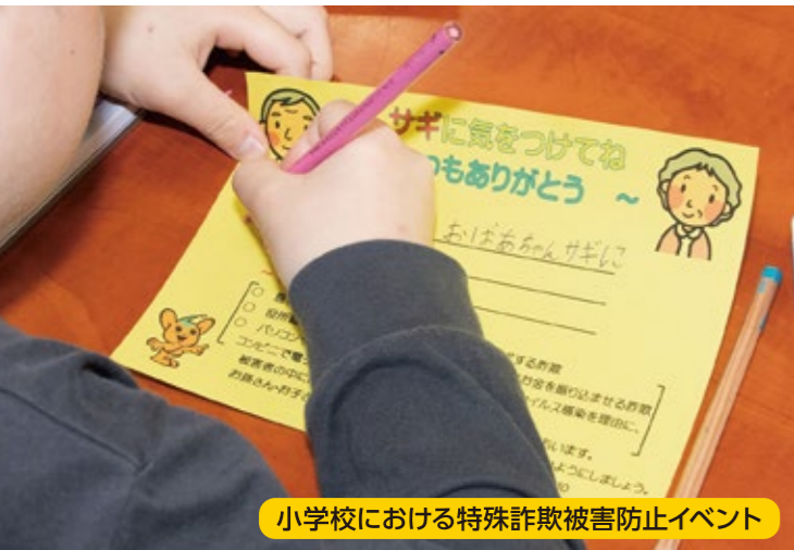
小学校における特殊詐欺被害防止イベント