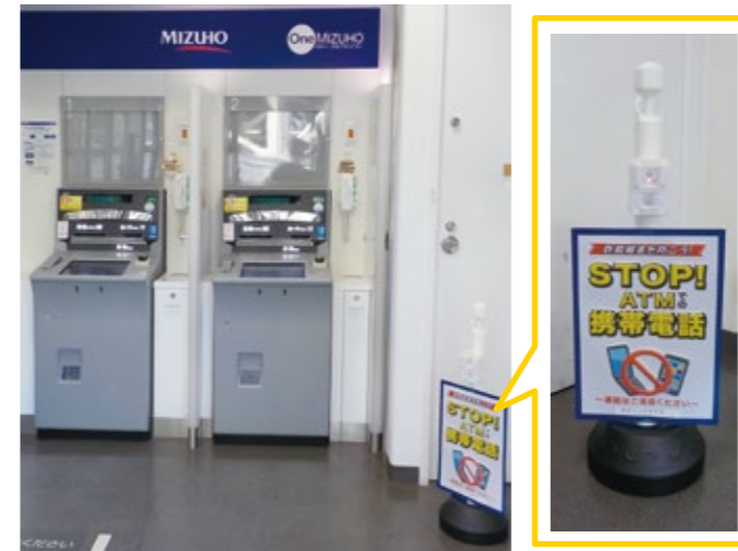
音声ポップによるATM警戒