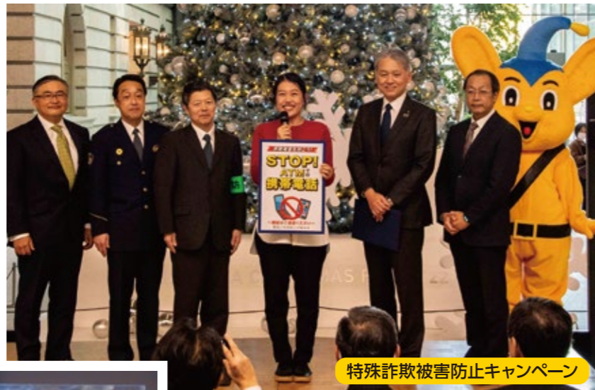
特殊詐欺被害防止キャンペーン