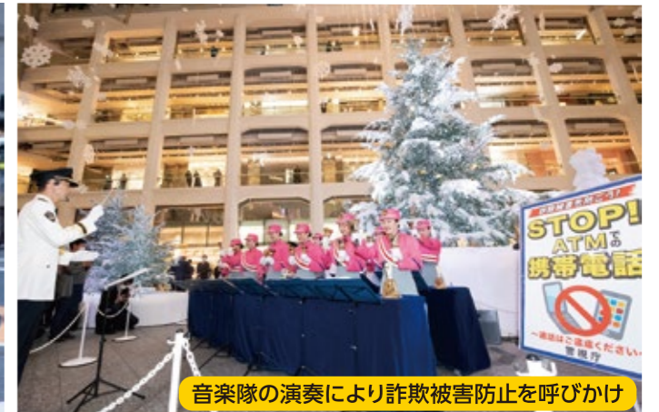
音楽隊の演奏により詐欺被害防止を呼びかけ