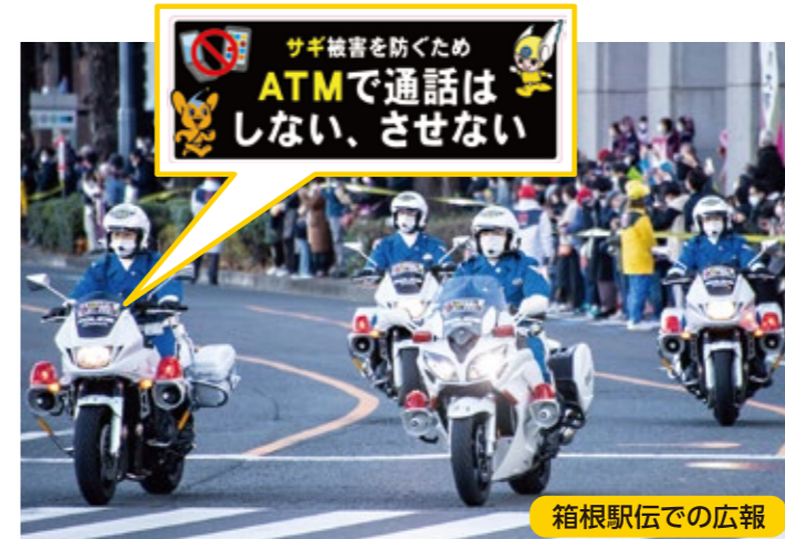
箱根駅伝での広報

警視庁では還付金詐欺被害防止対策として、「ATMコーナーでは携帯電話の通話をしない、させない」ことを社会のルールとして広める、「ストップ!ATMでの携帯電話」運動を推進しています。