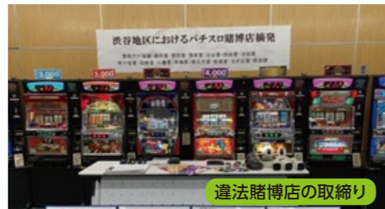
渋谷地区におけるパチスロ賭博店摘発 違法賭博店の取締り