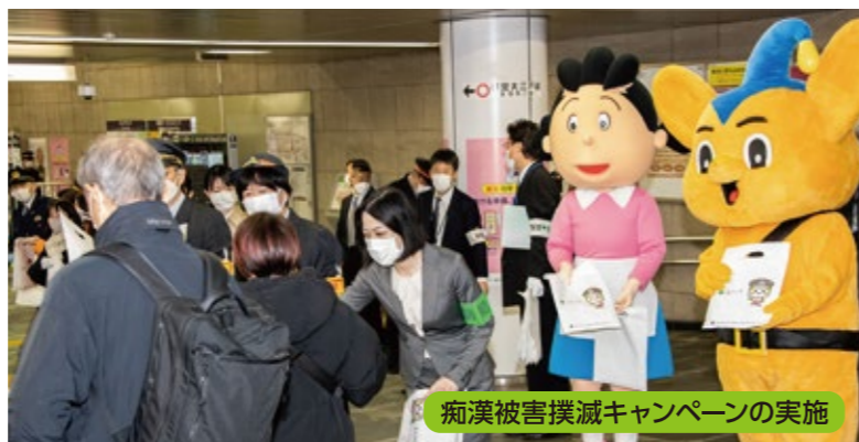
痴漢被害撲滅キャンペーンの実施