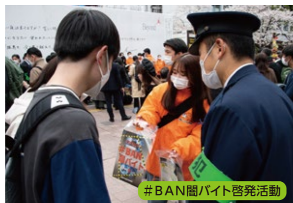
#BAN闇バイト啓発活動