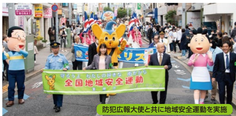
防犯広報大使と共に地域安全運動を実施