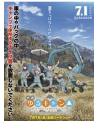
人気アニメとコラボして銃刀法違反を注意喚起