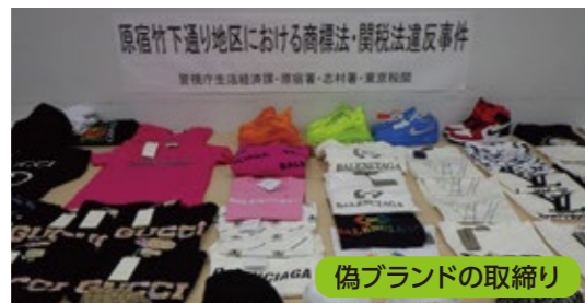
原宿竹下通り地区における商標法・関税法違反事件 警視庁生活環境課・原宿署・志村署・東大和署 偽ブランドの取締り