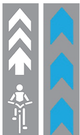
(左)自転車ナビマーク (右)自転車ナビライン