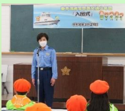
【東京湾岸警察署長】