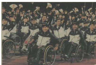
パラリンピック選手団