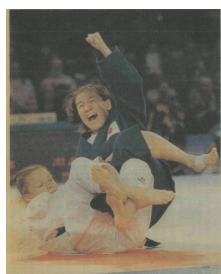
柔道 金 田村(現姓 谷)亮子