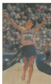
マラソン 金 高橋 尚子