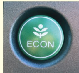
エコドライブスイッチの例

②エコドライブスイッチ * をONにしましょう。車の制御が変わって、ゆっくり加速しやすくなり、燃費が良くなります。