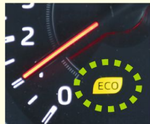
エコドライブランプの例

①エコドライブランプ * を点灯するように運転しましょう。アクセルをふんわり踏んで運転することになり、燃費が良くなります。