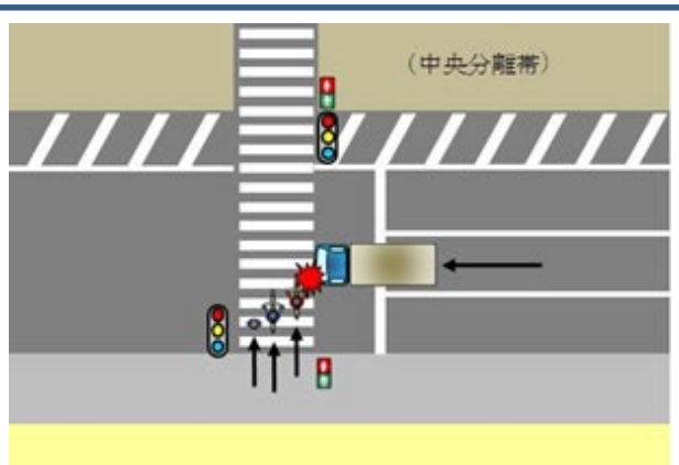
自家用中型貨物(信号無視) × 自転車

ご存知ですか？ この表示は、横断歩道や自転車横断帯の手前に設置されている道路標示です。