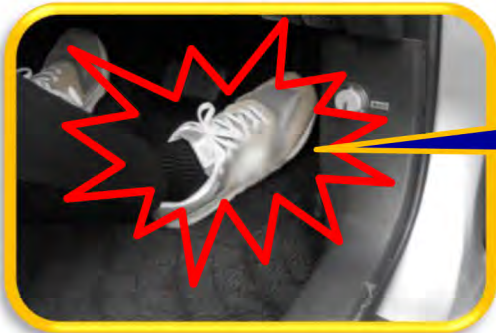
高齢者の踏み間違い事故による 死亡重傷事故発生件数(都内)