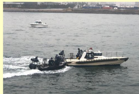
〔不審小型ボート捕捉訓練〕