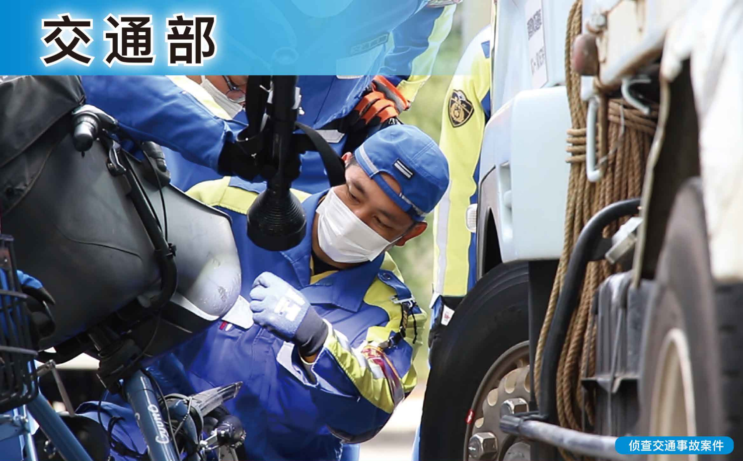
侦查交通事故案件