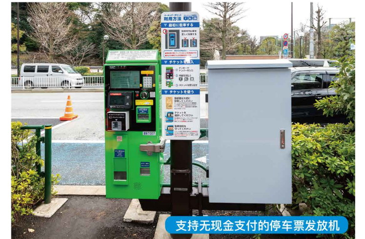
支持无现金支付的停车票发放机