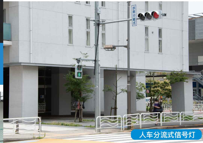
人车分流式信号灯

此外，除了劝导自行车和特定轻便摩托车的骑乘者佩戴骑行头盔外，还大力宣传车道通行原则等交通规则，加强对闯红灯、无视暂停标志等危险驾驶行为的指导查处。