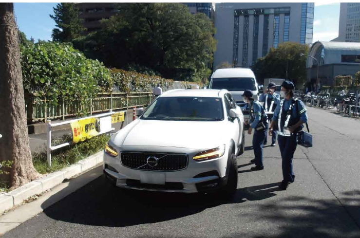
指导查处交通违法行为