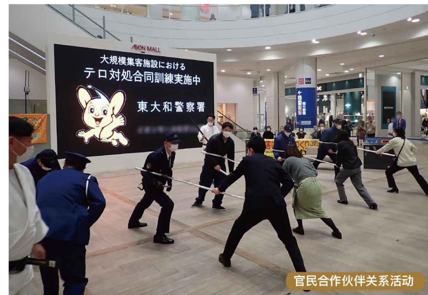
官民合作伙伴关系活动

此外，在由各警察局和民间企业及当地居民等构成的地区版合作中，以“建设不允许恐怖事件发生的街区”为口号，推进反恐联合训练、研修会、联合巡逻等依据地域特性的反恐对策。