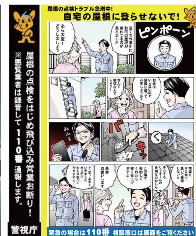
针对劣迹装修公司的对策 预防犯罪贴纸和宣传启迪传单

警视厅为了保护首都东京的安全和安心，正在开展满足市民期待和信赖的生活安全警察活动。