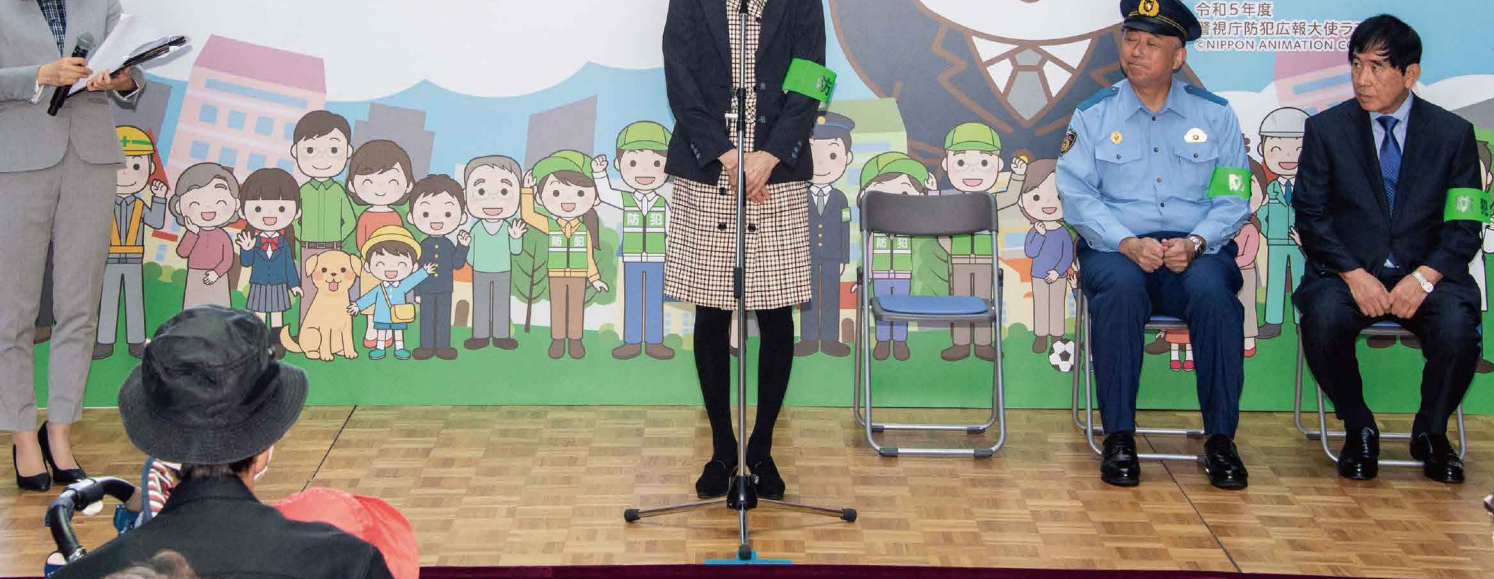
与防止犯罪宣传大使“Rascal”一起开展全国地区安全运动