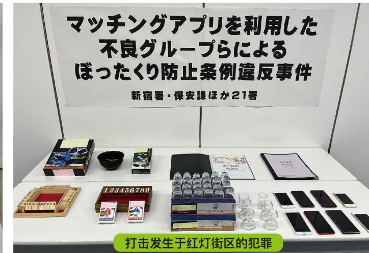
打击发生于红灯街区的犯罪