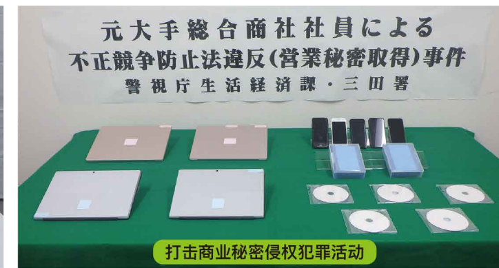
打击商业秘密侵权犯罪活动