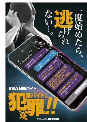
#BAN 黑暗打工 宣传启迪海报