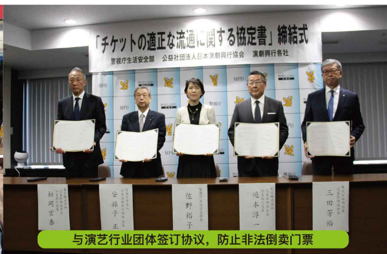
与演艺行业团体签订协议，防止非法倒卖门票