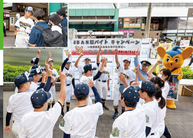
与高中的棒球部一起开展宣传启迪活动