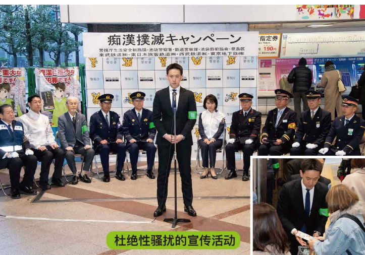
杜绝性骚扰的宣传活动