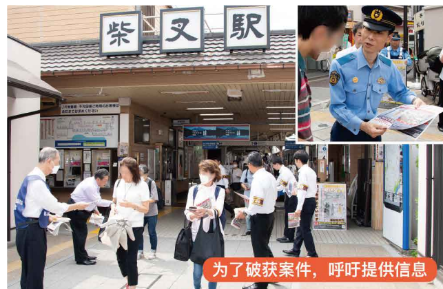
为了破获案件，呼吁提供信息

在东京都，每天都有很多给我们日常生活带来危害的犯罪发生，诸如“抢劫”、“性犯罪”、“特殊诈骗”、“入室盗窃”、“抢夺”等。警视厅在切实掌握和分析这些犯罪案件实际状况的同时，也采取在案件发生时迅速抵达现场、运用最新侦查手段等措施，强力推动开展迅速且有效的侦查，以期早日破获案件。