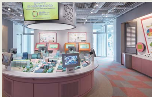
● 看一看 我们身边的巡警