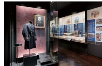
● 川路大警视 (第一任的警视总监)

基于时代背景和重大事件, 介绍警视厅的创立, 以及随着社会形态而不断变化的警察。