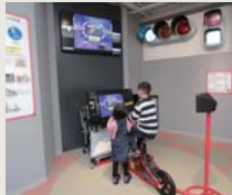
● 交通安全体验 (模拟骑自行车)

在防止犯罪和事故发生等方面, 东京都人民的协助是必不可少的。这里提供可现学现用的安保信息。