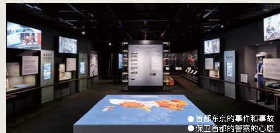
● 首都东京的事件和事故 ● 保卫首都的警察的心愿