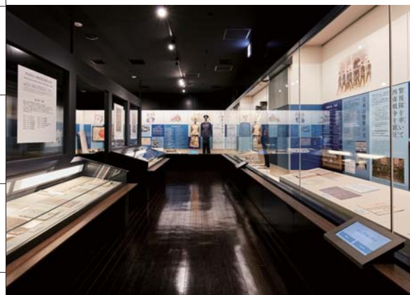
● 明治~平成年间的重大事件等