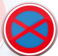
禁止停放和暂停车辆的标识