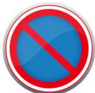
禁止停放车辆的标识