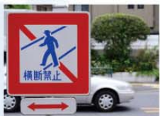
禁止过马路的标识