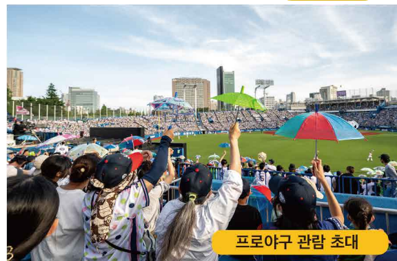
프로야구 관람 초대

또한 사회 전체에서 피해자를 지지하는 기운을 높이기 위해 중고생을 대상으로 한 '생명의 소중한 배우는 교실'을 개최하는 것 외에도 관계 기업의 협력을 얻어 사건·사고로 가족을 잃었던 아이들을 스포츠 관람이나 콘서트에 초대하고 있습니다.