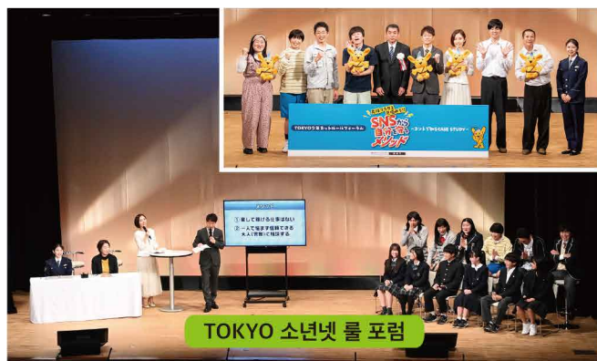
TOKYO 소년넷 롤 포럼