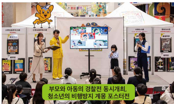
부모와 아동의 경찰전 동시개최, 청소년의 비행방지 계몽 포스터전