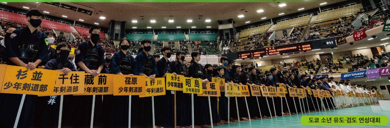
도쿄 소년 유도·검도 연성대회