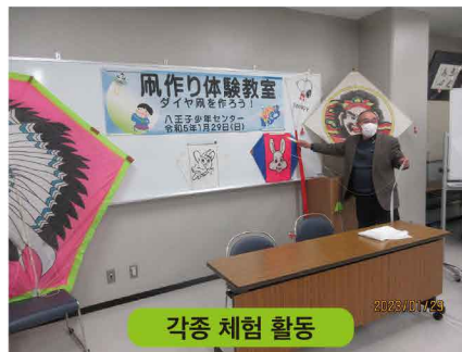
각종 체험 활동

경시청은 지역사회나 학교, 관계 기관·단체와 연계하여 청소년의 비행 및 범죄피해를 방지하기 위해 SNS 이용과 관련된 비행·피해 방지 대책을 추진하는 것과 함께 '비행 청소년이 생기지 않는 사회 만들기' 위해 길거리 계도 활동을 비롯하여 효과적인 비행방지 교실의 개최 등, 다각적인 경찰활동을 전개하여 청소년의 건전육성 활동을 위해 노력하고 있습니다.