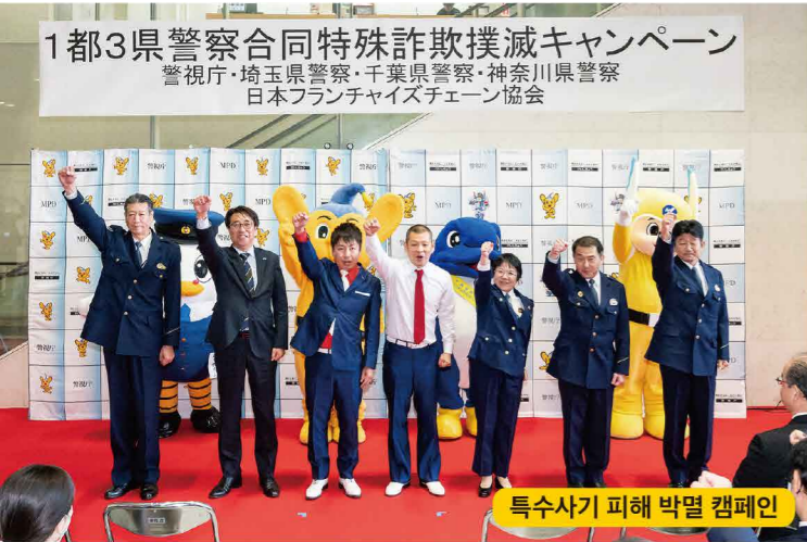
특수사기 피해 박멸 캠페인