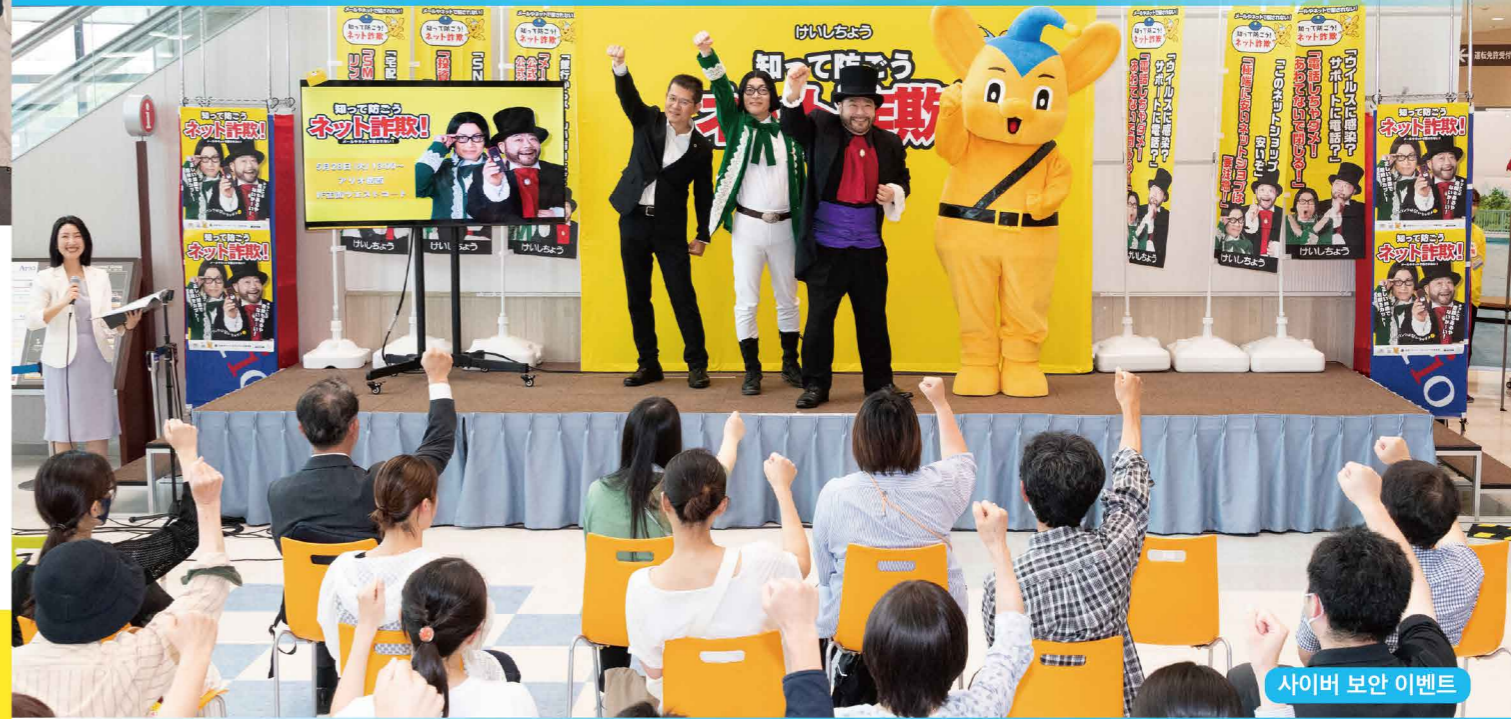
사이버 보안 이벤트