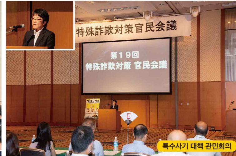
특수사기 대책 관민회의

1都3県警察合同特殊詐欺撲滅キャンペーン 警視庁・埼玉県警察・千葉県警察・神奈川県警察 日本フランチャイズチェーン協会