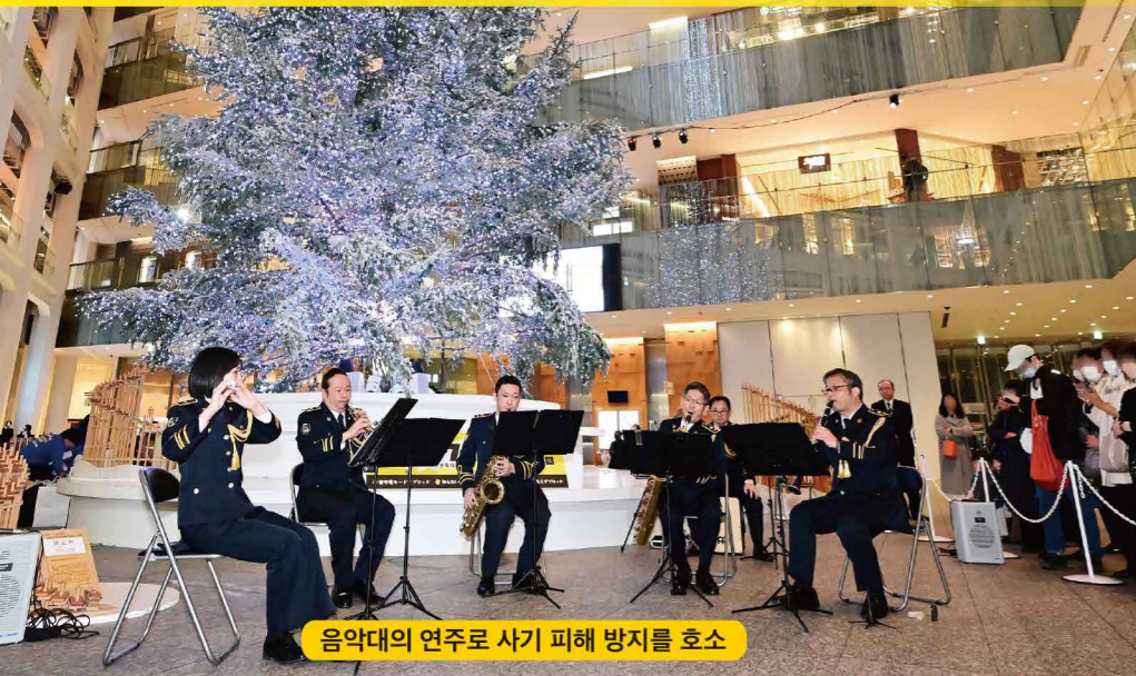
음악대의 연주로 사기 피해를 호소