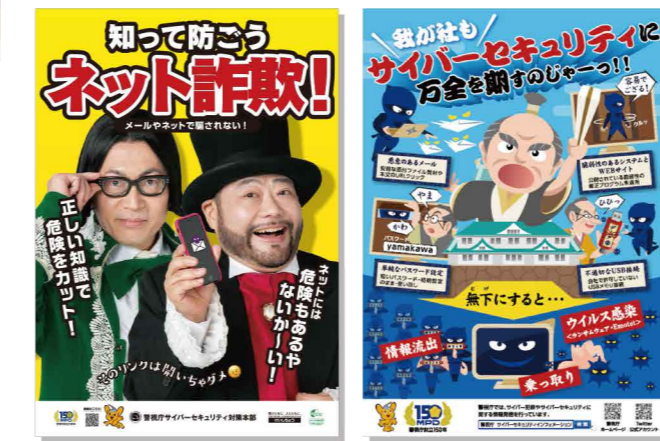
홍보 개몽 포스터