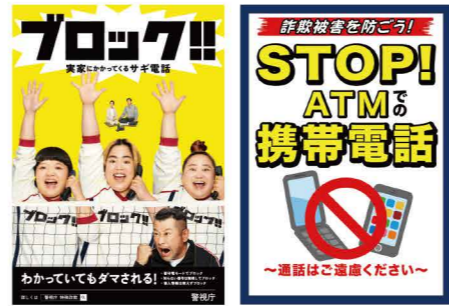
홍보 개몽 포스터