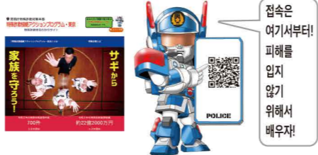
경시청 특수사기대책본부 캐릭터 스토브군