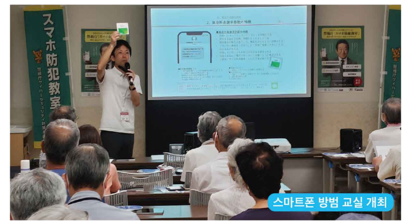
스마트폰 방범 교실 개최

사이버 공간이 이전보다 더 사회경제 활동의 중요한 공공공간이 되는 한편, 랜섬웨어나 피싱 등의 피해가 끊이지 않습니다. 경시청은 사이버 공간의 안전·안심을 확보하기 위해 SNS 등을 활용한 정보 발신이나 스마트폰 방범 교실, 세미나의 개최 등, 사이버 범죄 피해를 미연에 방지하는 활동을 추진하고 있습니다.