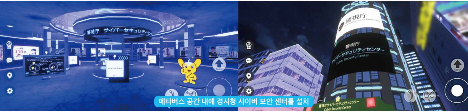
메타버스 공간 내에 경시청 사이버 보안 센터를 설치