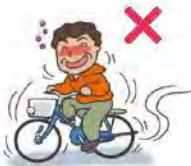
බීමනින් පා පැදි පැදවීම තහනමය