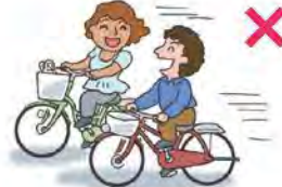
සමාන්තරව එකට සිට පැදවීම තහනමය