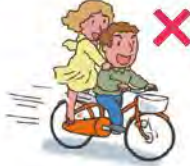
දෙදෙනෙකු ගමන් කිරීම තහනමය