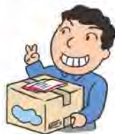
නම් කරන ලද ස්ථානයකට යම් දෙයක් යැවීම