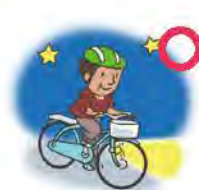
රාත්‍රියේදී පා පැදි ලාංඡු භාවිතා කරන්න