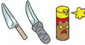
පිහියා සහ ගම් මිරිස් ද්‍රවණ