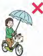
කුඩයක් සවිකොට පැදවීම තහනමය