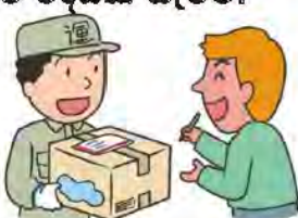
වෙනත් අයකුගේ නම භාවිතා කොට එවනු ලබන පසුම්බි භාර ගැනීම