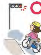
මංසන්ධිවලදී රළු වාහන සංඥාවන් පිළිපදින්න. නැවතී ආරක්ෂාව තහවුරු කර ගන්න