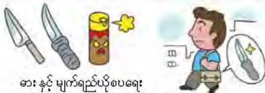
ဓား နှင့် မျက်ရည်ယိုစပရေး

ခိုင်လုံသော အကြောင်းပြချက်မရှိလျက် ဓားမြှောင်ကဲ့သို့သော အန္တရာယ်ရှိသည့်ပစ္စည်းများကို လက်ဝယ်တွေ့ရှိပါက အရေးယူအပြစ်ပေးခြင်း ခံရနိုင်ပါသည်။