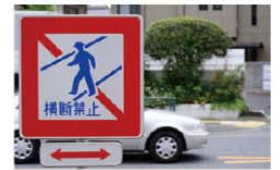
Señal de prohibido cruzar