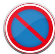
Señal de prohibido estacionar