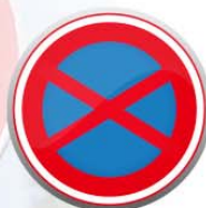
Señal de prohibido estacionar y parar